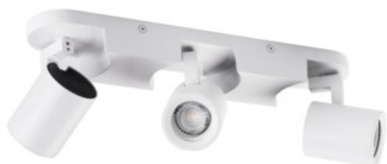
LAURIN EL-3I W