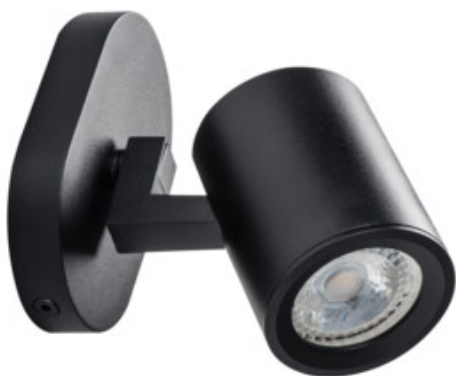
LAURIN EL-10 B