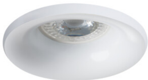
ELNIS S W