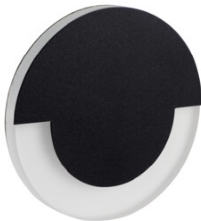
SOLA LED B