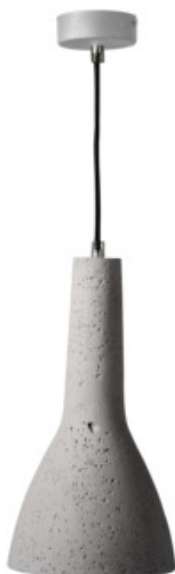
ETISSA D20 GR