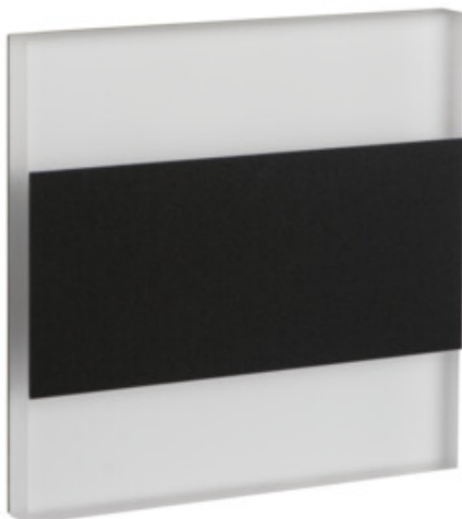
TERRA LED B