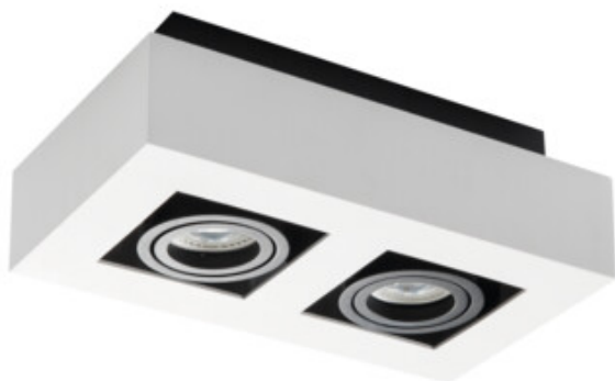
STOBI DLP 250-W