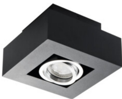
STOBI DLP 50-B