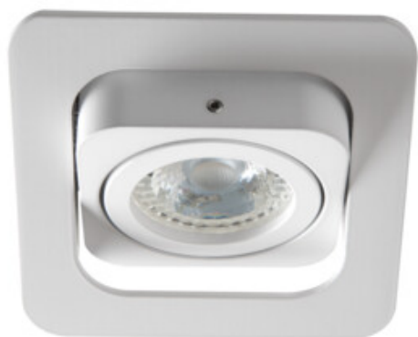
ALREN R DTL-W