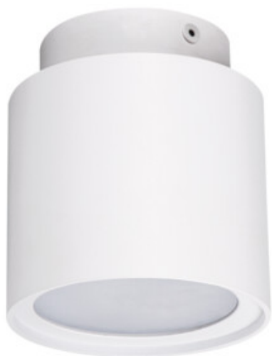
SONOR GU10 CO-W