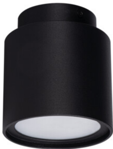
SONOR GU10 CO-B