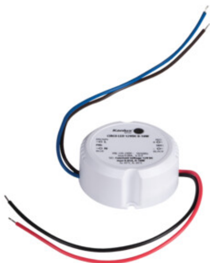
CIRCO LED 12VDC