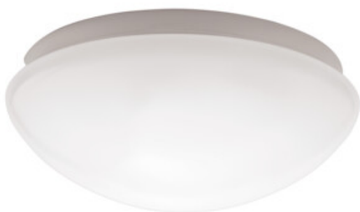
PIRES ECO DL-250 NS