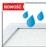
nowe wersje IP65