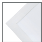
biała obudowa z mlecznym kloszem