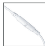
szybkozłączka zasilacza ułatwiająca montaż