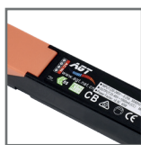
zasilacz AGT w komplecie