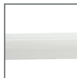
szkło w kolorze mlecznym