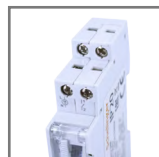
TSGM1 zaciski wyjściowy 1xN0 (max 2,5mm 2 )