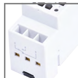
TSGE2 zaciski wyjściowe 1xN0 i 1xNC (max 2x2,5mm 2 )