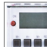
TSGE2 dioda sygnalizująca załączenie styku NC