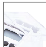
TSGE2 zamykana obudowa