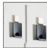
pojemność zacisków 25mm 2