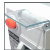
wyposażony w okienko do opisu