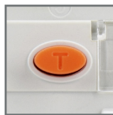
przycisk kontrolny TEST