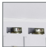
możliwość połączenia za pomocą szyn grzebieniowych