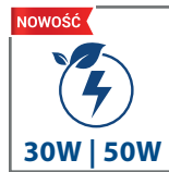
nowe wersje i większa wydajność świetlna