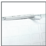
oprawy 30W i 40W mieszczące się w ramce 40mm