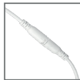
szybkołączka zasilacza ułatwiająca montaż