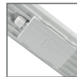
hermetyczna komora przyłączeniowa