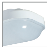
mleczny klosz oprawy