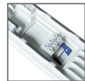
komora przyłączeniowa, możliwość zasilania przelotowego