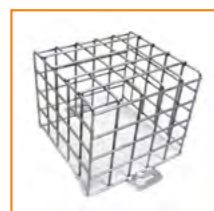
opcjonalna kratka ochronna