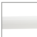
szkło w kolorze mlecznym