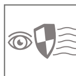
brak efektu migotania