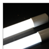
diody LED o zwiększonej wydajności