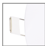
mocowanie podtynkowe za pomocą uchwytów