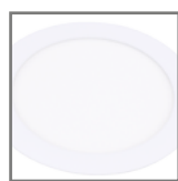
ramka w kolorze białym