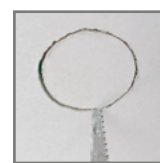
średnice otworów montażowych

DLB-R-090: ø135 DLB-R-120: ø155 DLB-R-180: ø205 DLB-R-240: ø285 DLB-S-090: 135x135 DLB-S-120: 155x155 DLB-S-180: 205x205 DLB-S-240: 285x285