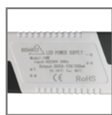
zewnętrzny zasilacz w komplecie