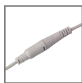
szybkowiązka zasilacza ułatwiająca montaż