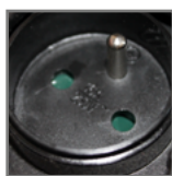
4ZRF - 4 gniazda typ E (CEE 7/5)