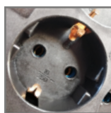
4ZRS - 4 gniazda typ F (CEE 7/3)