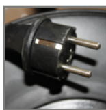
wtyczka sieciowa (CEE 7/7)