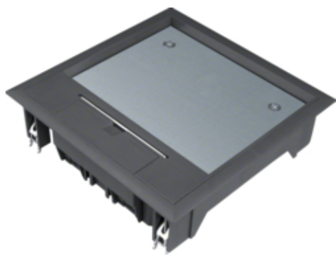
tehalit.VE-EE Pokrywa uchylna VQ06 200x200 wykładzina 12mm czarny PA