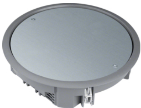
tehalit.VE-EE Pokrywa pełna VDR06 fi215 wykładzina 5mm stal szary PA