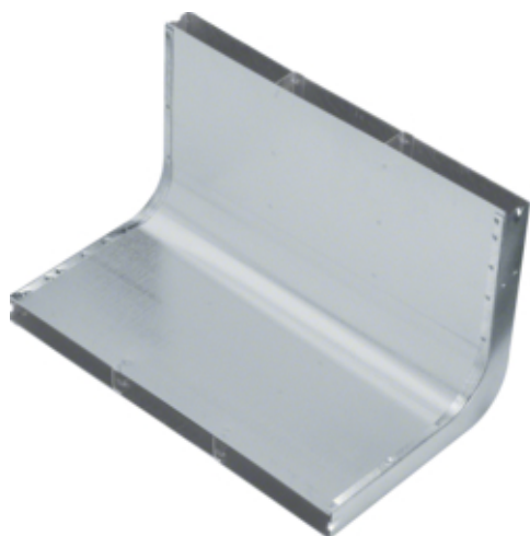
tehalit.UK Narożnik pionowy 3-komorowy 340X28mm stal