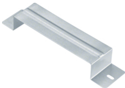
tehalit.UK Uchwyt zabezpieczający 190X38mm stal