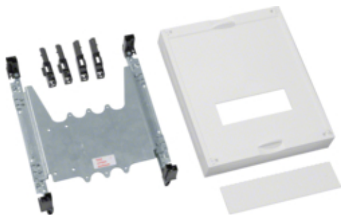
univers N Blok do MCCB 250A