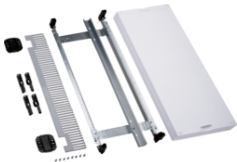
univers N Blok dla zacisków szeregowych pionowych 600x250mm