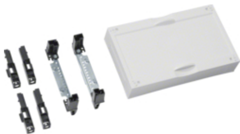
univers N Blok pusty 150x250mm