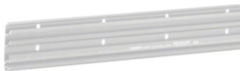
tehalit.SLH Podstawa PC ABS 20x80mm