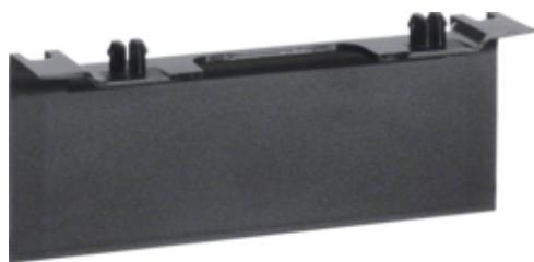
tehalit.SL Maskownica nośnika 20x115 fi 60 czarny