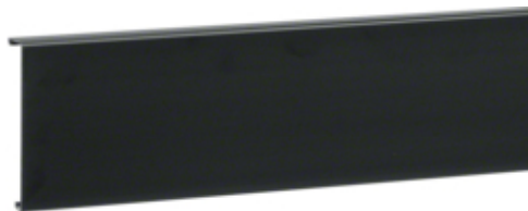
tehalit.SL Pokrywa 20x115 czarny