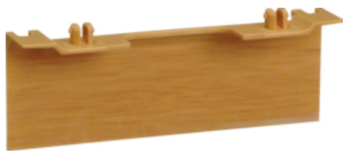
tehalit.SL Maskownica nośnika 20x80 fi60 dąb