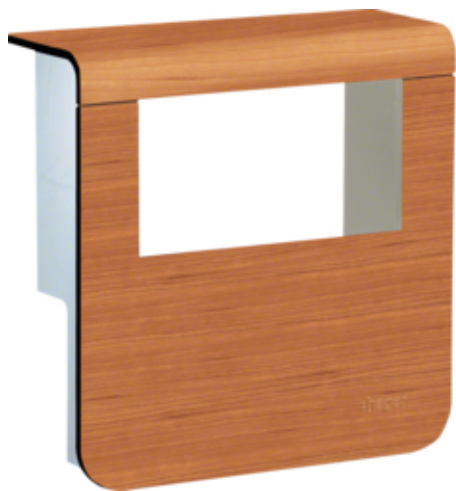
tehalit.SL Pokrywa nośnika urządzeń 20x80 2*45x45 wiśnia