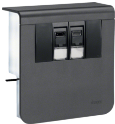
tehalit.SL Nośnik urządzeń 20x80 2xRJ45 Kat.6 czarny