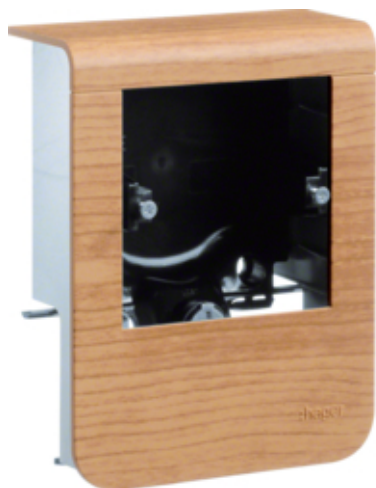
tehalit.SL Pusty nośnik urządzeń 20x80 fi60 buk