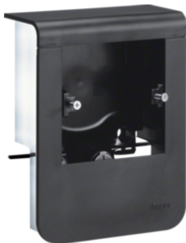
tehalit.SL Pusty nośnik urządzeń 20x80 fi60 czarny