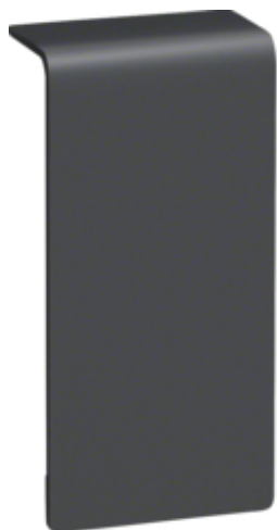
tehalit.SL Łącznik 20x80 czarny