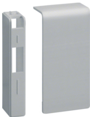
tehalit.SL Końcówka 20x80 alu