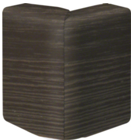
tehalit.SL Kąt zewnętrzny regulowany 20x80 sucupira