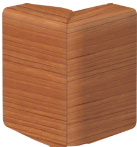
tehalit.SL Kąt zewnętrzny regulowany 20x80 wiśnia