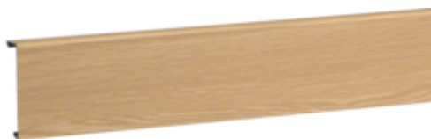
tehalit.SL Pokrywa 20x80 dąb