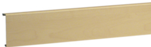
tehalit.SL Pokrywa 20x80 klon