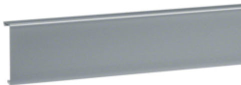
tehalit.SL Pokrywa 20x80 alu