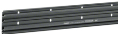
tehalit.SL Podstawa 20x80 czarny