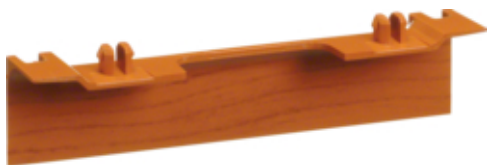
tehalit.SL Maskownica nośnika 20x55 fi60 wiśnia