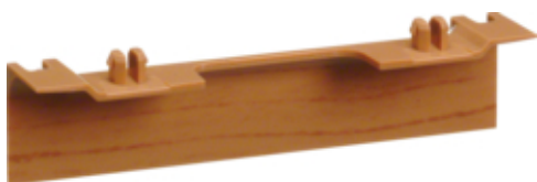
tehalit.SL Maskownica nośnika 20x55 fi60 buk