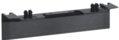
tehalit.SL Maskownica nośnika 20x55 fi60 czarny