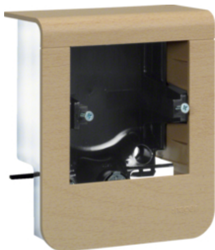
tehalit.SL Pusty nośnik urządzeń 20x55, fi60, klon